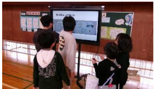
4年生「わくわくまちがいさがし」 “げきムズ問題”もありますよ