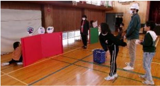
2年生「モンスターをたおせ！」（的に当てるとクイズができます！）