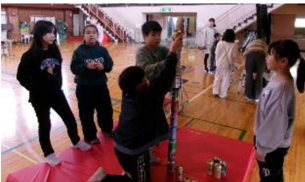
3年生「たのしいあきかんつみゲーム」 いくつ積めるかな？