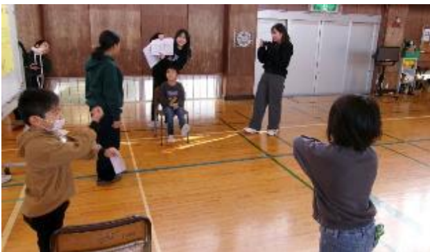
5・6年生「ジェスチャーゲーム」 答える人の想像力も大事