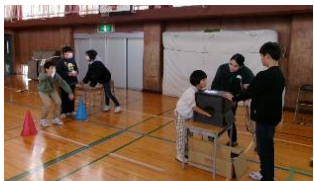
5・6年生「箱の中身はなに？」 子どもたちはすぐに当てていました