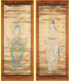
下村観山《普賢文殊》1909年頃

【展示室1】近代美術館の名品-新収蔵品を中心に-令和元年度に新しく収蔵された日本画や版画を中心に紹介します。 【展示室2】生誕110年佐藤哲三と蒲原の画家達蒲原の地に生きた佐藤哲三の作品を、仲間の画家たちの作品とともに紹介します。 【展示室3】中村忠二 詩情と激情 何気ない日常を描いた中村忠二の世界を紹介します。