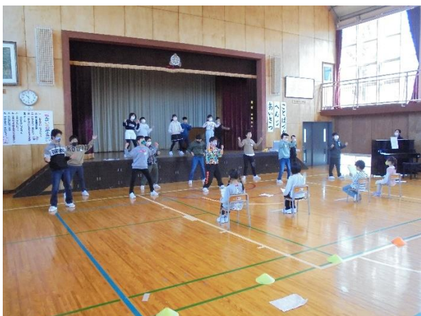
3～6年生のダンス、すごい！