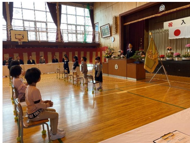
返事も上手にできました！