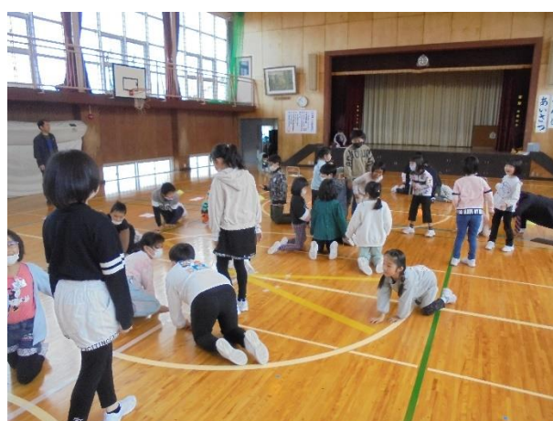
「進化じゃんけん」楽しかった！