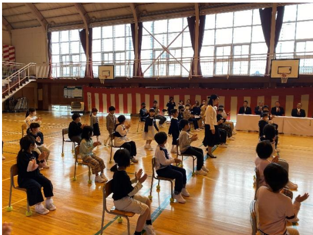
みんなの拍手、うれしいな！